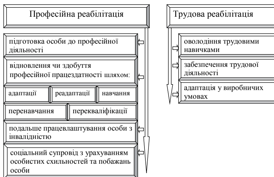
Рис. 1. Заходи професійної та трудової реабілітації

Закон України «Про зайнятість населення» від 5 липня 2012 року № 5067-VI [8] визначає правові, економічні та організаційні засади ре-