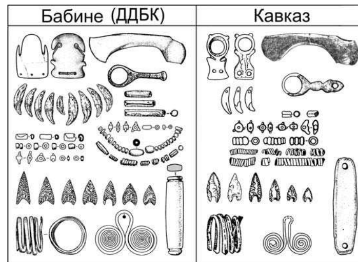
Рис. 1. Бабинсько–кавказькі паралелі в матеріальній культурі

Повної аналогії цій посудині, абсолютно чужій для Бабине, в керамічному комплексі гінчинської культури знайти не вдалося та й сподіватися на це, за відсутності жорстких стандартів виробництва за доби бронзи, було б не виправданним. Проте у розглянутій корчі втілено всі діагностичні риси гінчинської керамічної традиції, а тому