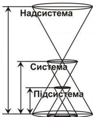
Рис. 1 В.А. Поляков. Системний комплекс

Наявність надсистемного причинного чинника (духовності) та багаторівневість ієрархічної системи призводять до розуміння, що рух імпульсу причини сходить від більшої системи до меншої, проходячи крізь весь системокомплекс. Для людини надсистемою є колектив (зокрема сім'я), для колективу – суспільство, для суспільства – планетарна система, або цивілізація, для планети – сонячна система, і так далі у космічному єднанні систем Всесвіту. Підсистемою людини є системи органів, кожної з них підсистемою є органи, для органів – тканини, для тканин – клітини, для клітин – клітинні елементи тощо до проматерії. Таким чином, причина життя і функціонування людини, її життєдіяльність, у тому числі здоров'я його систем та органів, обумовлює взаємодію з надсистемою і ієрархічно пов'язана з вищим, тобто трансцендентністю. Так підсистеми людини виступають фракталами нескінченного цілісного всесвіту та побудовані на універсальних законах буття. Існування та функціонування кожної з підсистем детерміновано надсистемою та виступає підґрунтям для наступного принцип холізму – цілеорієнтованістю.